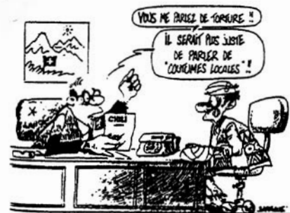
Art. 5 Droit de ne pas être soumis à la torture