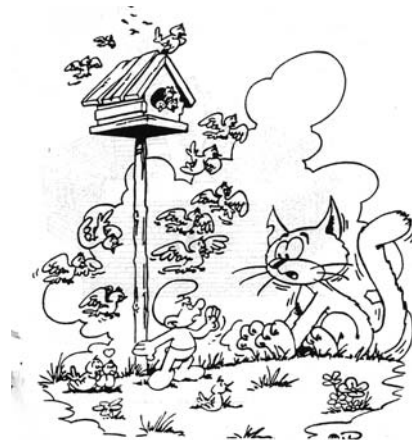
Art. 16 Droit au mariage et à la protection de la famille