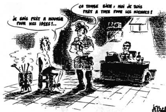
Art. 3 Droit à la vie, à la liberté et à la sûreté de sa personne