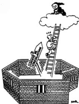
Art. 13 Droit de circuler librement et de choisir le pays où l'on veut vivre