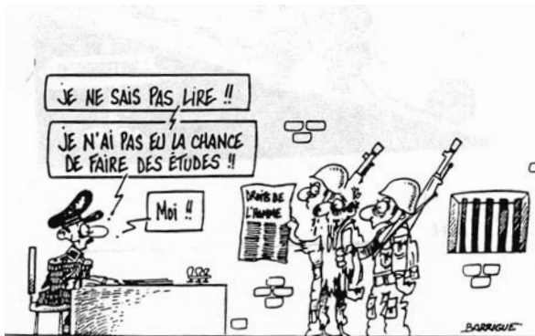
Art. 26 Droit à l'éducation