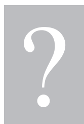
Où te situes-tu ?

Pas d'argent pour CD/cinéma – les stars célèbres ont bien assez d'argent.