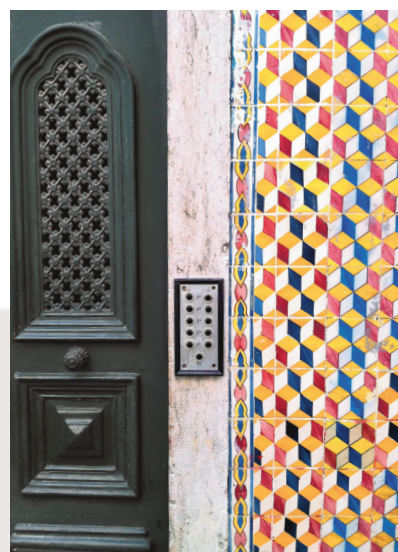
Façade carrelée de Lisbonne.

Si la pose de carrelage de forme carrée semble aisée, les souhaits des clients peuvent être plus complexes et demandent au carreleur sens artistique et aptitudes géométriques pour un art proche de la mosaïque.