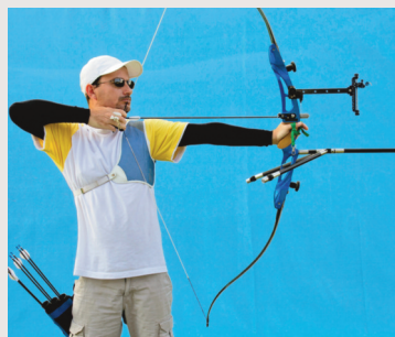
... et aujourd'hui.