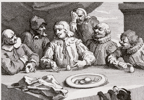
Colomb cassant l'œuf, gravure de William Hogarth, 1753.

L'expression « œuf de Colomb » est parfois utilisée pour qualifier une idée simple et ingénieuse. Elle proviendrait d'une anecdote :