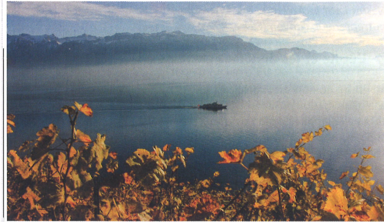
La Suisse en automne