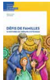
Extraits de «Défis de familles, 16 histoires de thérapie systémique», Nahum Frenck et Jon Schmidt, Editions Loisirs et Pédagogie.

«Mieux vaut comprendre les erreurs du passé pour ne pas les répéter plutôt que de le ressasser pour se convaincre qu'on n'y est pour rien.»